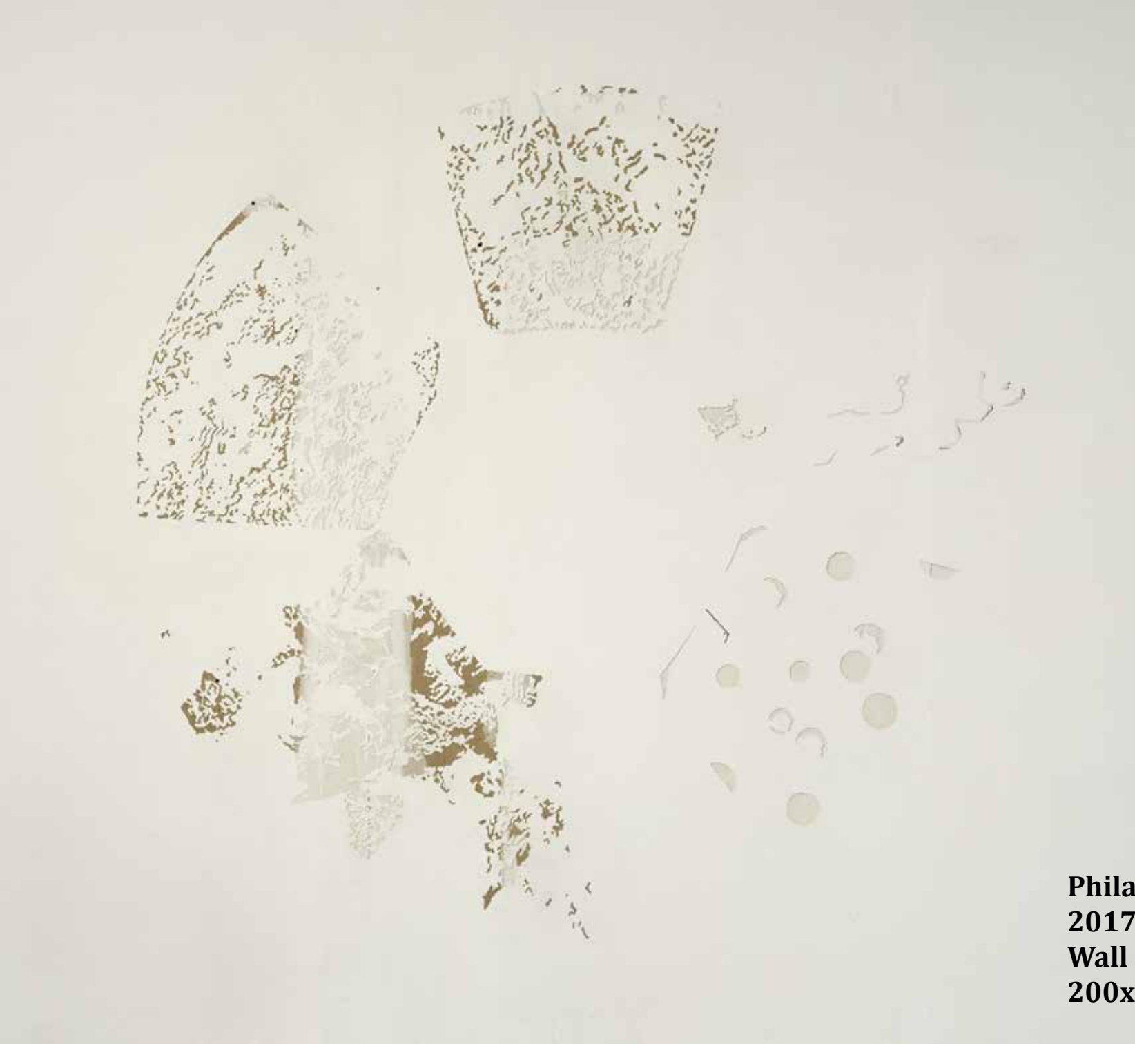
Philae 2017 Wall engraving 200x200 cm