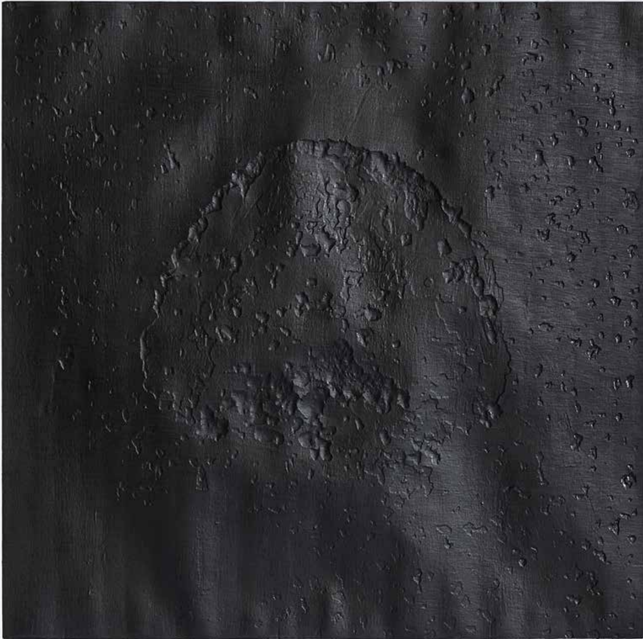
Untitled 2017 pencil on paper 90X90 cm