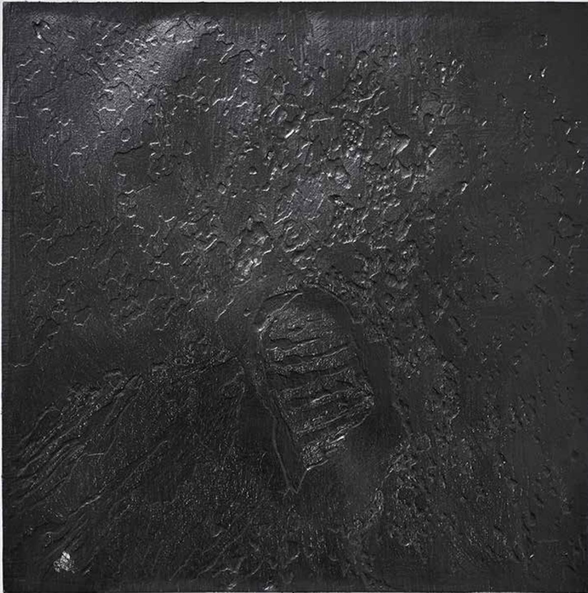
a step 2016 pencil on paper 70X70 cm