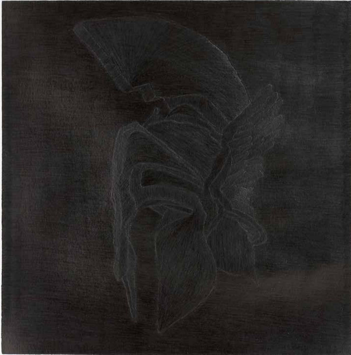
Mercury 2017 pencil on paper 70X70 cm