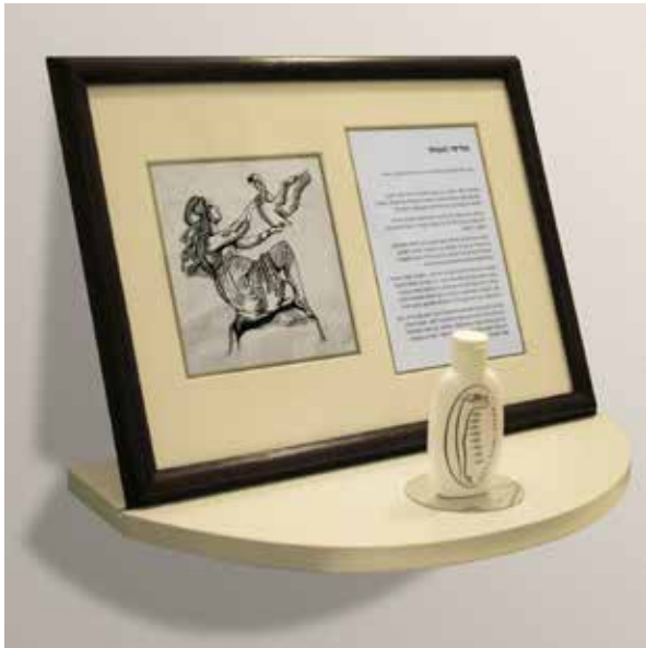
אליסי משחה להסרת שיער גוף מיותר לנשים, הושקה בכרתים ב-1923.